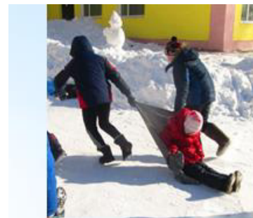
4 этап. Транспортируйте раненого.